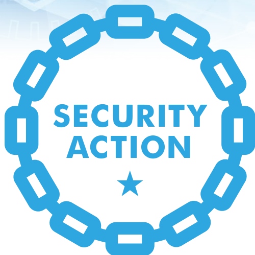
セキュリティ対策自己宣言