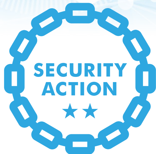
セキュリティ対策自己宣言

「SECURITY ACTION」は中小企業自らが、 情報セキュリティ対策に取り組むことを自己宣言する制度です。 「中小企業の情報セキュリティ対策ガイドライン」の実践を ベースとした2段階の取り組み目標を用意しています。 自社の情報セキュリティを高め、強い組織を目指しましょう。